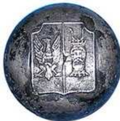
Герб Люблинского, Мазовецкого и Плоцкого воеводств на форменных пуговицах

Гербом Люблинского воеводства был пересеченный щит, в его верхней половине в червлёном поле был изображен скачущий серебряный олень с золотой короной на шее (герб прежнего Люблинского воеводства), в нижней половине – в зелёном поле серебряный медведь между трёх золотых деревьев (герб прежнего Хелмнинского воеводства).