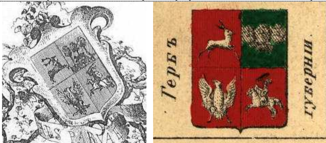
Изображения герба Люблинской губернии

Гербом Варшавской губернии стал 7-частный щит, в первом поле которого в червлёном поле был изображён серебряный агнец Божий с серебряной хоругвью с золотым крестом на серебряном кресте, из груди которого бьёт золотая струя крови в золотую чашу (Грааль), во втором поле – чёрная голова буйвола в золотой короне и с золотым кольцом в ноздрях в червлёно-серебряном поле, третье поле рассечено в золото и серебро, в его правой золотой части половина восставшего медведя, в левой серебряной части – половина червлёного орла, увенчанные общей золотой короной (эти три части представляли герб бывшего Калишского воеводства), в 4-ой части – в червлёном поле серебряный одноглавый орёл в червлёном поле (герб исторического Мазовецкого воеводства), во второй части – в золотом поле половина чёрного льва и половина чёрного орла, увенчанные одной общей золотой короной (герб бывшего Куявско-Брестского воеводства), в шестой рассеченной части – в правой серебряной половине – половина червлёного