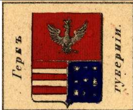
Изображения герба Радомской губернии

Гербом Радомской губернии стал щит, в верхней части которого в червлёном поле был изображён серебряный одноглавый орёл влево, а над ним – золотая корона (герб бывшего Краковского воеводства), а нижняя часть, представлявшая собой герб бывшего Сандомирского воеводства, была рассечена на два поля, из которых правое 5-кратно пересечено в червлень и серебро, а в правом, лазоревом, помещены в три ряда 9 (3+3+3) золотых шестиконечных звезд