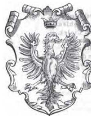
Гербы Августовского, Калишского воеводств (на пуговицах) и Краковского воеводства.

Гербом Августовского воеводства был рассеченный щит, в правой червлёной половине которого была изображена серебряная погоня (герб Великого Княжества Литовского и его Троцкого воеводства), в левой червлёной половине – стоящий влево на задних лапах чёрный медведь в серебряном ошейнике (герб Самогитского княжества)