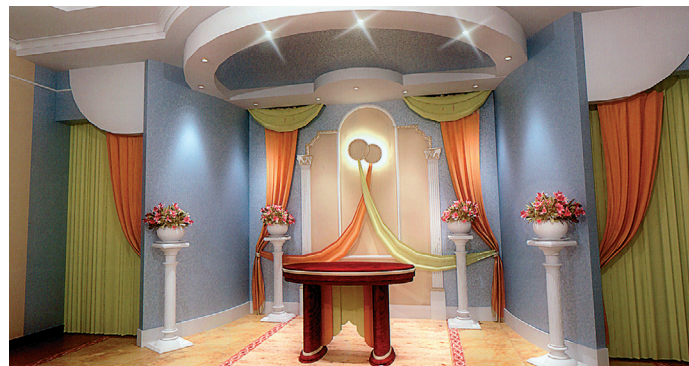
Новый зал бракосочетаний и регистрации родившихся жителей громады в здании Мирновского сельского совета (открытие в сентябре 2009 г.)